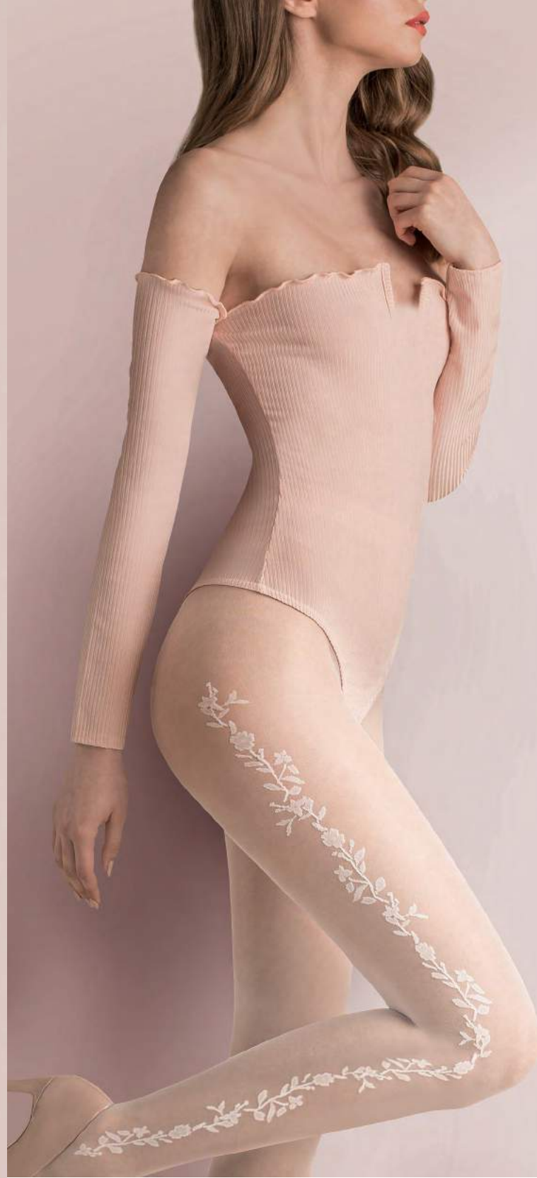
tights CLEMENTINE code 478