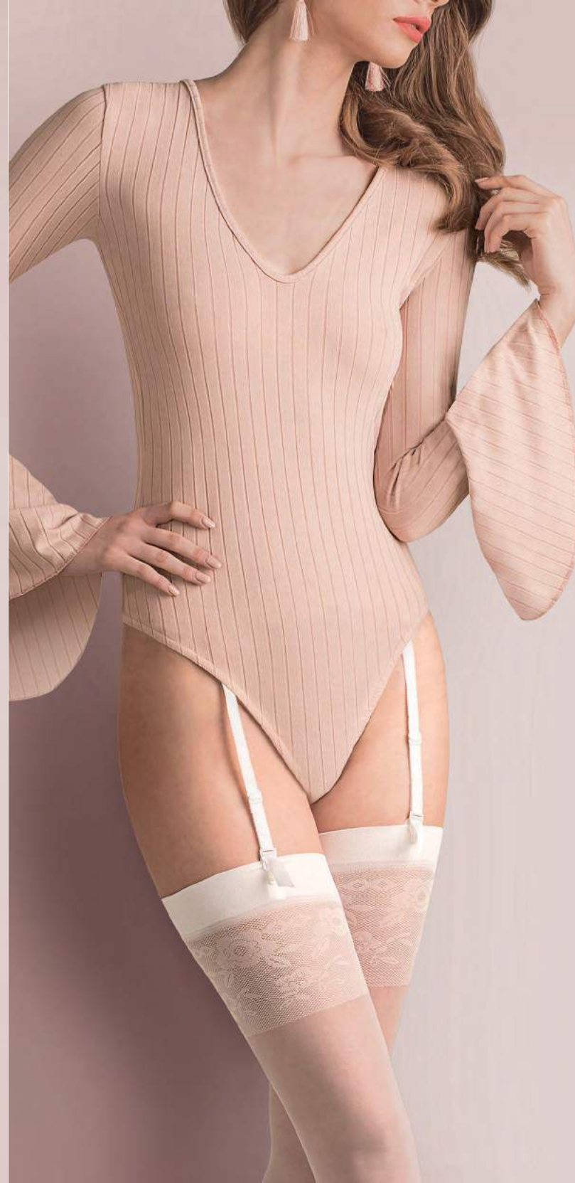
stockings VANESSA code 476