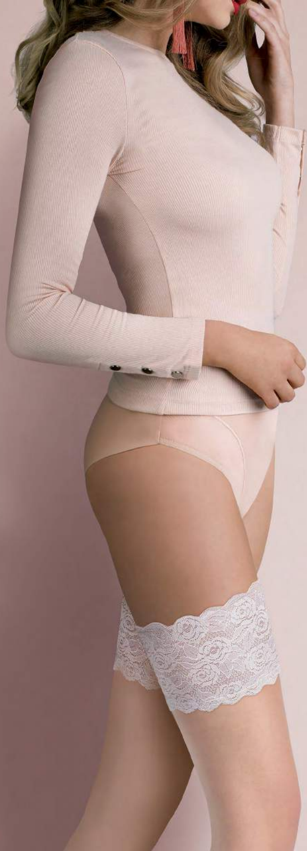
hold ups ISABELLE code 472