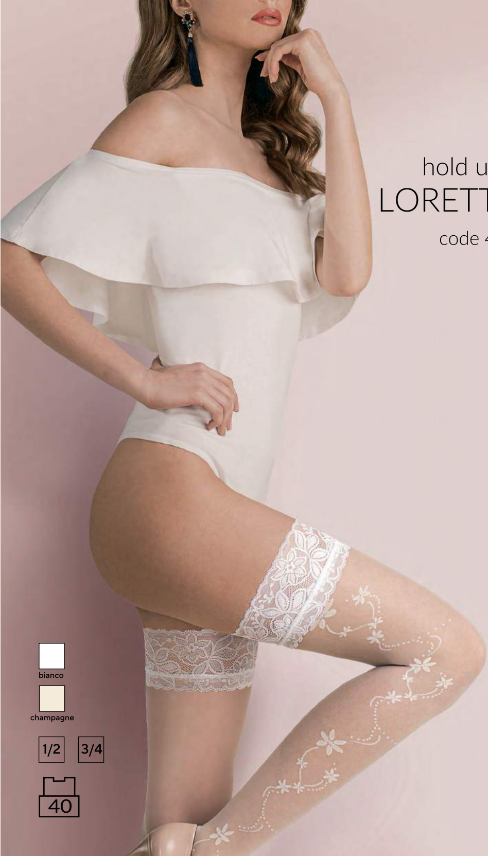
hold ups LORETTA code 477